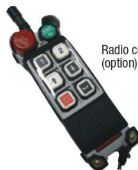
Radio commande (option)